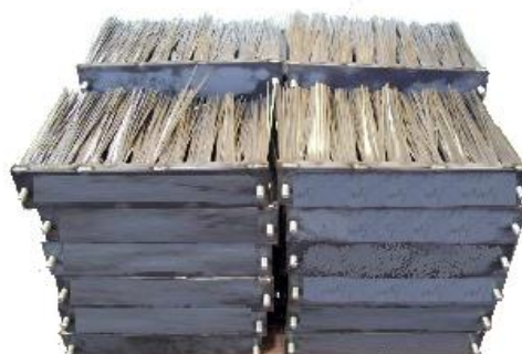
KIT RICAMBI PER TUTTE LE MARCHE SPARE PARTS FOR ALL BRANDS