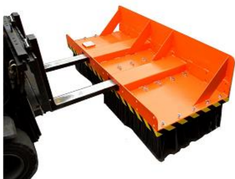
LAMA ANTERIORE DI SPINTA PUSHING FRONT BLADE