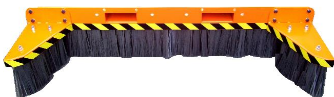
SPONDE ANTERIORI DI CONTENIMENTO CONTAINMENT SIDES